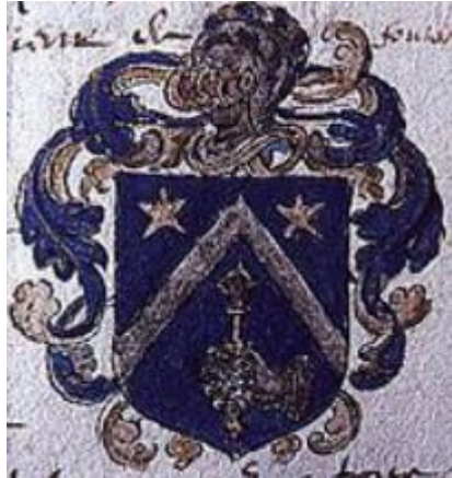
Blasons contenus dans les registres de la Cour des Aides 1575-1789 - AD 76.

Armes : "d'azur au chevron d'argent, accompagné en chef de 2 étoiles d'or et d'une main d'argent armée d'une massue d'or en pointe".