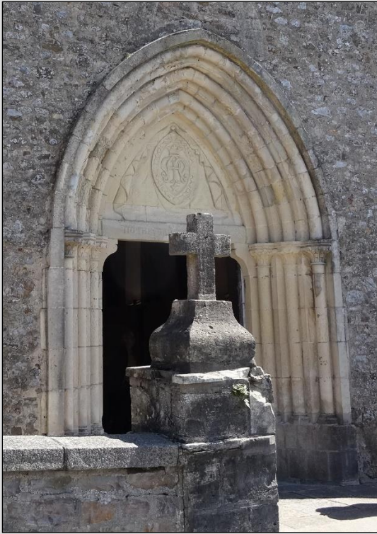
Portail en pierre calcaire