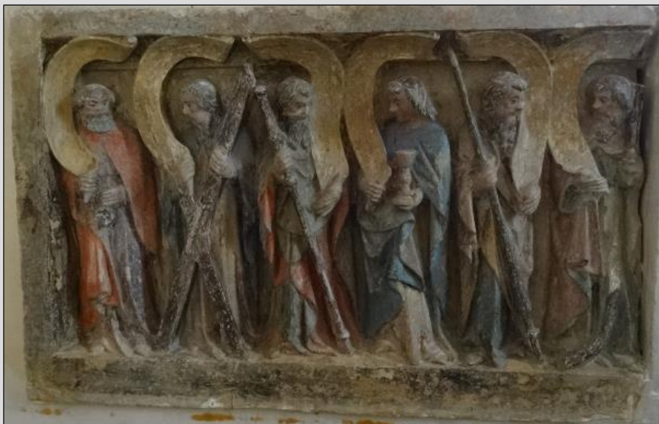
Retable du Vrétôt

Les apôtres conversent deux à deux et déploient des banderoles où s'inscrivaient les paroles du Credo.