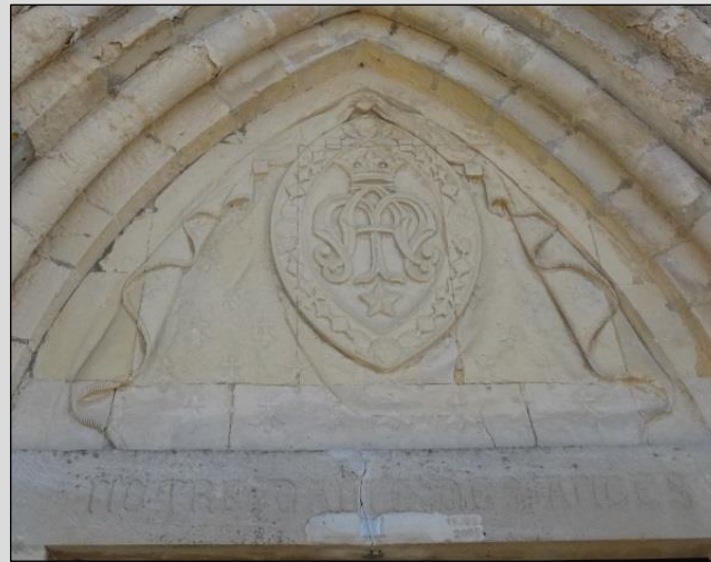
Détail du portail